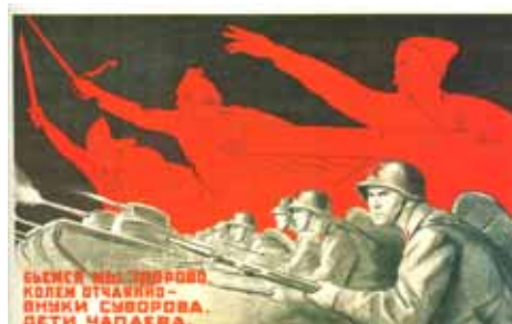
Kukryniksy (Mikhail Kupriyanov, Porfiri Krylov e Nikolai Sokolov). Lutamos com bravura e coragem; somos netos de Suvurov e filhos de Chapaev , 1941, cartaz.