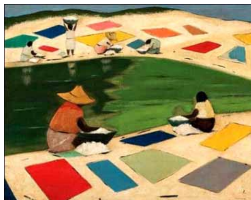
José Pancetti. Lavadoras do Abaeté , 1957, 45 cm × 60 cm, coleção particular.