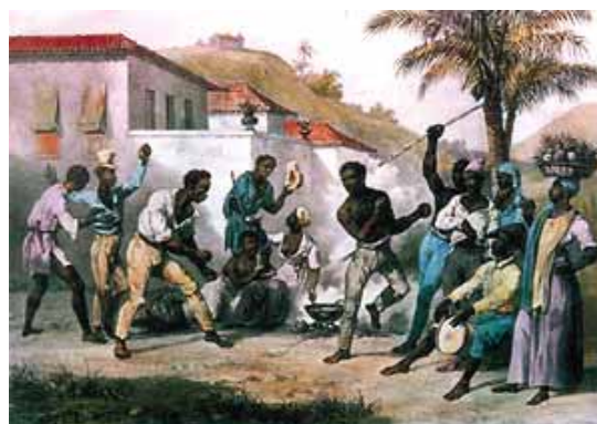
Maritz Rugendas. Jogar Capoeira, ou Dança da Guerra , 1835, litografia aquarelada.