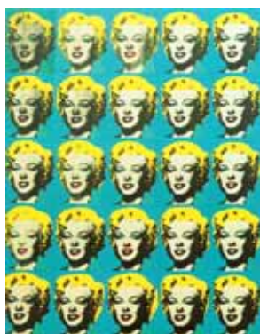
Andy Warhol. 25 Marilyns coloridas , c.1962, serigrafia sobre tela, 208 cm × 144 cm, Tate Gallery, Londres.