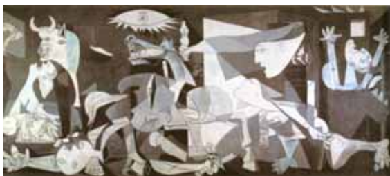
Pablo Picasso. Guernica , 1937, óleo sobre painel, 350 cm × 782 cm, Museu Rainha Sofia.