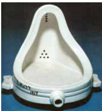
Marcel Duchamp. A Fonte , 1917, escultura, urinol industrial, porcelana branca, 60 cm, Tate Modern, Londres.