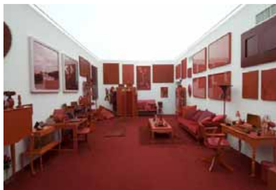
Cildo Meireles. Desvio para o Vermelho , 1967-1984, Inhotim, MG.